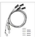
Suspension kit LKITA0000000188