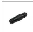
Connecteur rapide IP 5 pôles LKITA000000000103