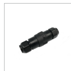
Connecteur rapide IP 5 pôles LKITA00000000013