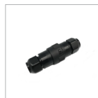
Connecteur rapide IP 4 pôles LKITA00000000018