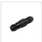
Connecteur rapide IP 2 pôles LKITA00000000017