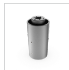
Raccord de poteau Ø 60-80mm LKITA00000000064