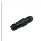
Connecteur rapide IP 3 pôles LKITA00000000003