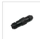
Connecteur rapide IP 5 pôles LKITA00000000103