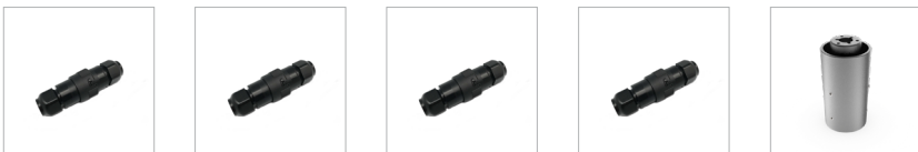
Connecteur rapide IP 2 pôles LKITA00000000017 Connecteur rapide IP 3 pôles LKITA00000000003 Connecteur rapide IP 4 pôles LKITA00000000018 Connecteur rapide IP 5 pôles LKITA00000000103 Raccord de poteau Ø 60-80mm LKITA00000000064