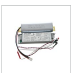
Kit emergency LKITA00000000083