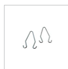
Crochets de suspension LKITA00000000085