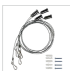
Suspension kit LKITA00000000188